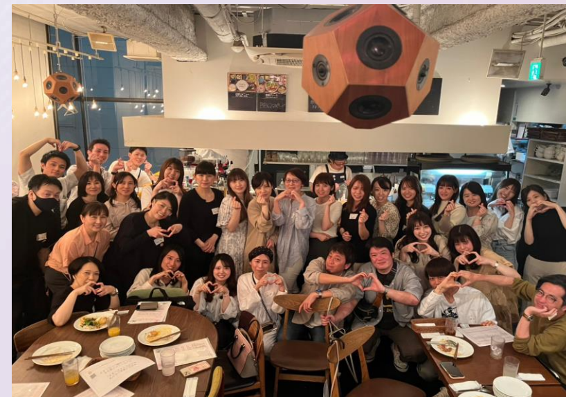
(第1回交流会：掲載許可済)